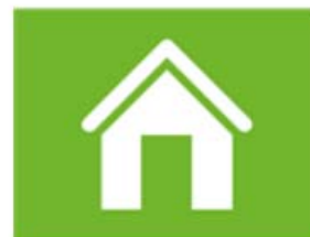
wonen en woonomgeving