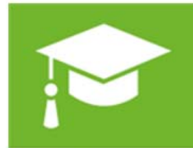
onderwijs en vorming