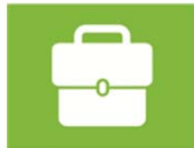
ondernemen en werken