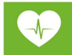
zorg en gezondheid