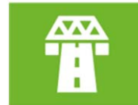
ruimte en infrastructuur