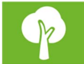
natuur, milieu en energie