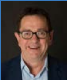
Ward Vergote burgemeester Moorslede