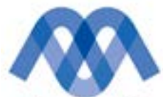
MENSEN MAKEN MOORSLEDE