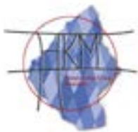
Heemkundige Kring Moorslede

Met medewerking van 't Rommelkorps uit Slypskapelle.