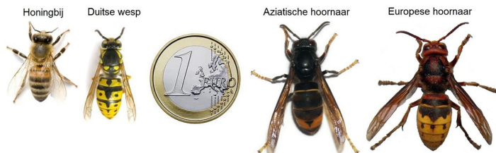
Figuur: bijen, wespen en hoornaars op schaal naast elkaar. De Aziatische hoornaars heeft 2 kleuren: zwart en weinig geel op het achterlijf. De Europese hoornaar heeft 3 kleuren: zwart, roodbruin en veel geel op het achterlijf.

De Aziatische hoornaar is een grote, donkere wesp. Ze is groter dan een gewone wesp en iets kleiner dan de inheemse Europese hoornaar. Je kan een Aziatische hoornaar goed herkennen aan haar unieke kleurencombinatie (zie figuur). Op de kop en het borststuk zijn ze volledig zwart. Ook het achterlijf is grotendeels zwart met slechts één brede gele band. De pootjes zijn zwart met opvallende gele tipjes. De Aziatische hoornaar wordt het meest verward met de Europese hoornaar. Maar met een beetje oefenen zal je gauw merken dat het verschil zeer duidelijk is.