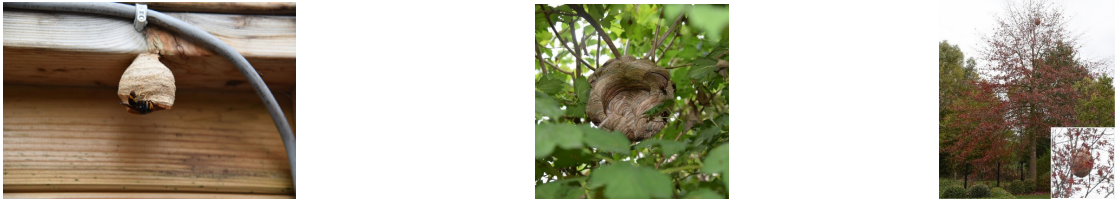
Figuur: de nesten van de Aziatische hoornaar in mei (links), augustus (midden) en oktober (rechts). In de lente bouwen hoornaars bolvormige nestjes in bvb een tuinhuis, houtkot of carport. Vanaf de zomer verhuist het nest naar een hoge boomtop.

Echter, het plan kan alleen slagen met de hulp van de bevolking. Jong of oud, natuurliefhebber of gewone wandelaar, specialist of leek, echt iedereen kan een steentje bijdragen door de ogen open te houden en bij het zien van een hoornaar of nest dit zo snel mogelijk te melden. Dit kan je doen op het portaal van de werkgroep Aziatische hoornaar: vespawatch.be .