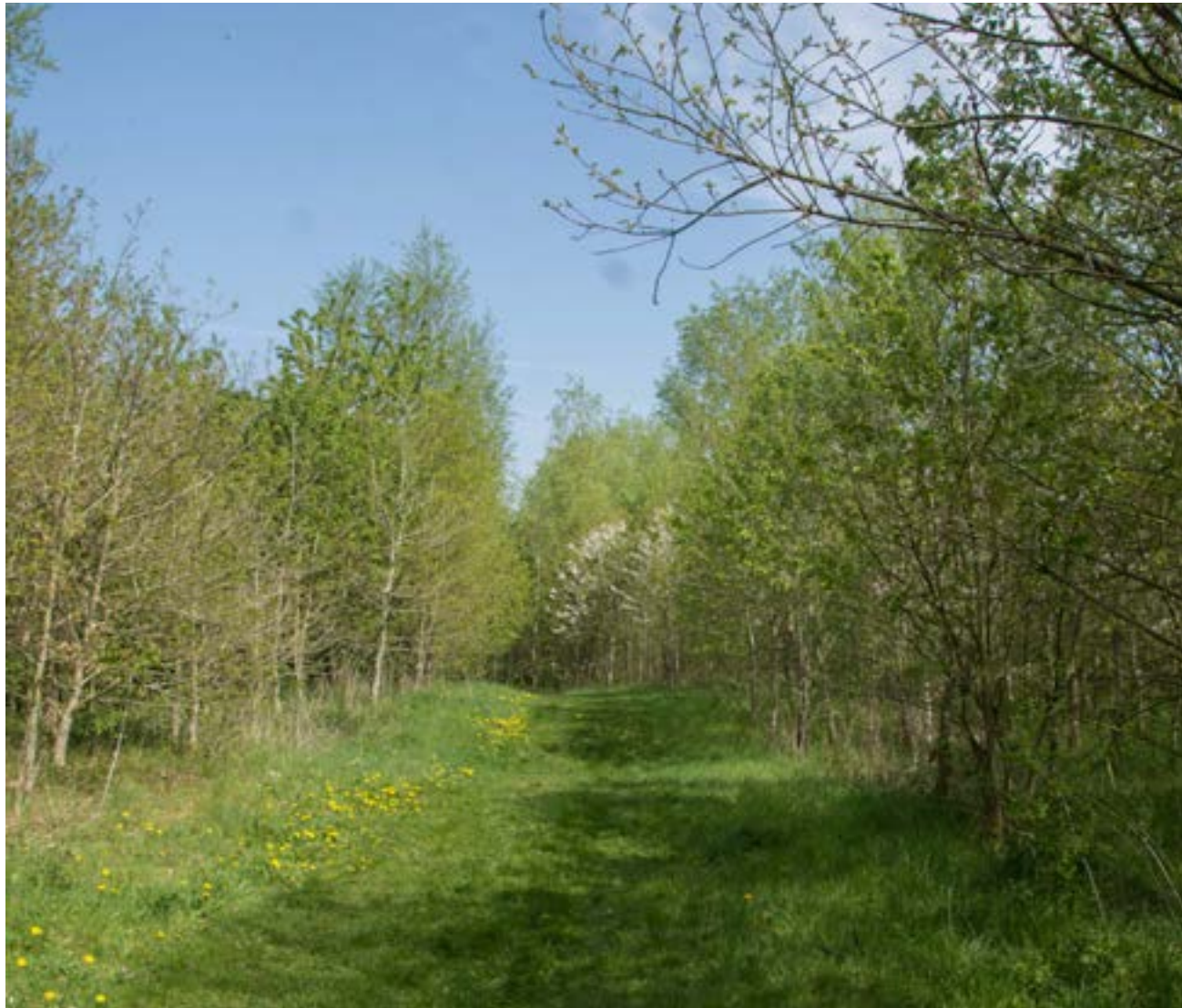
Vierkavenbos