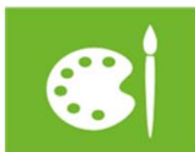
cultuur en vrije tijd