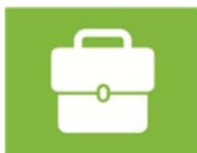
ondernemen en werken