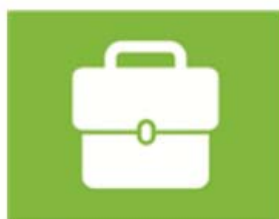
ondernemen en werken