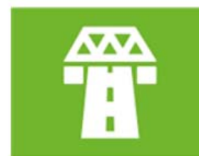
ruimte en infrastructuur