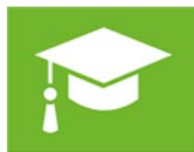
onderwijs en vorming