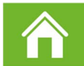
wonen en woonomgeving