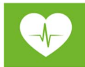
zorg en gezondheid